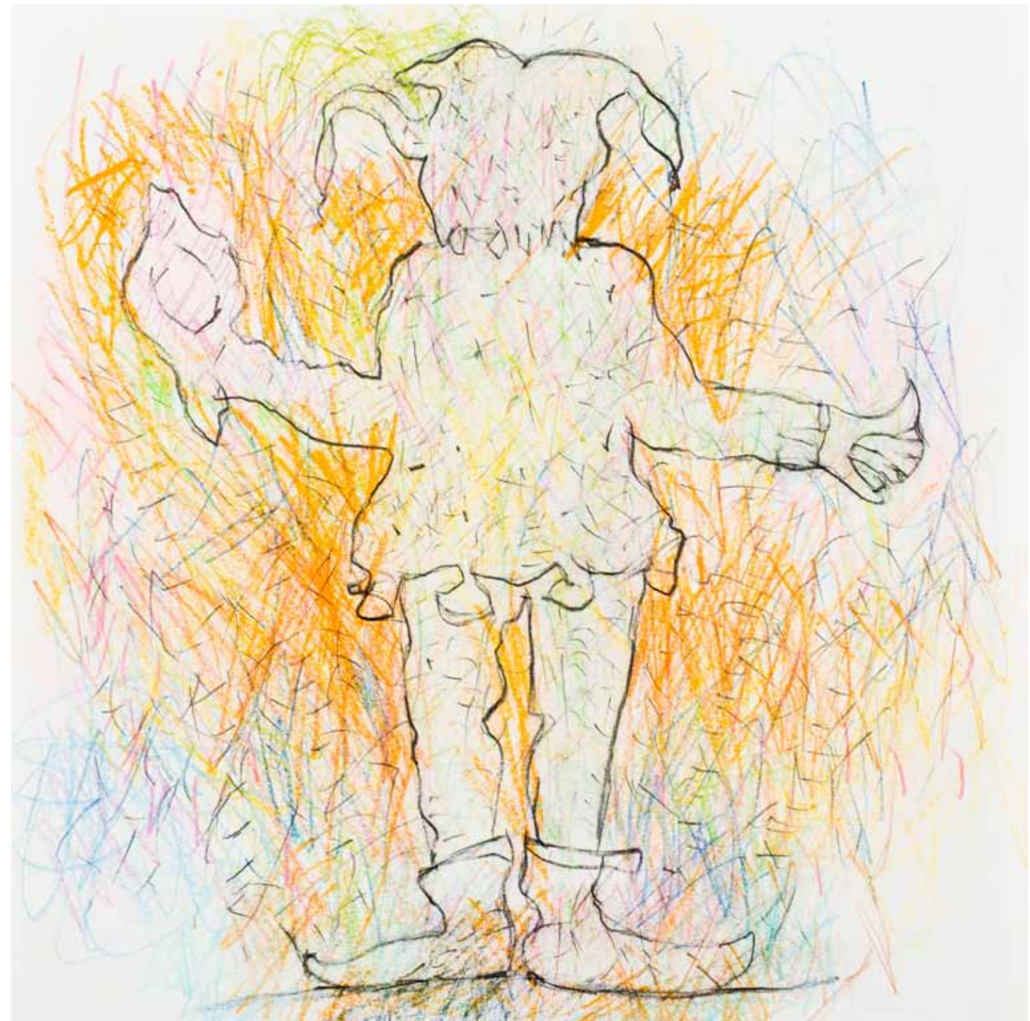
wo sind sie land buntstift papier 25 x 25 cm