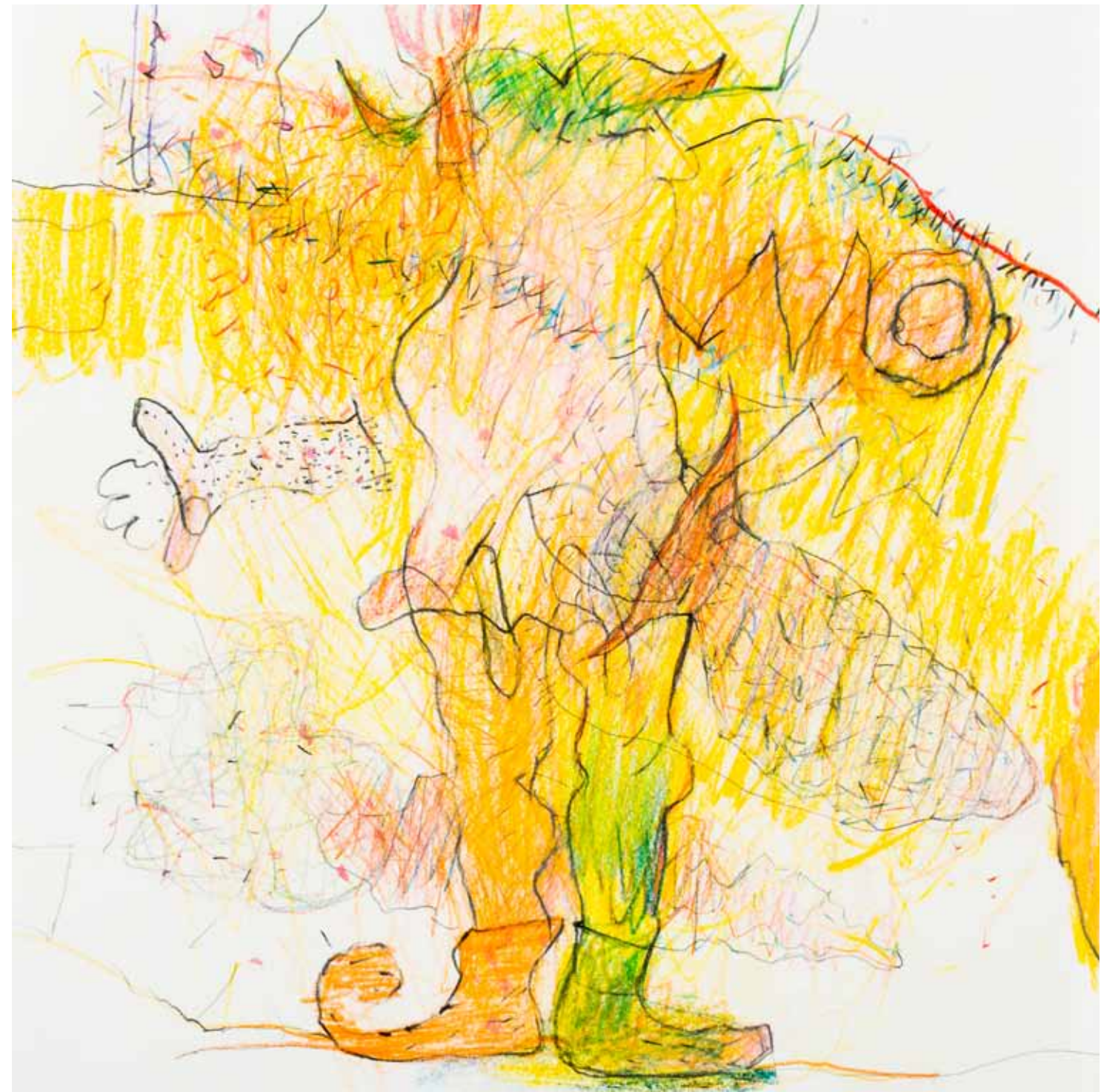
ich habe nachgedacht über das buntstift papier 25 x 25 cm