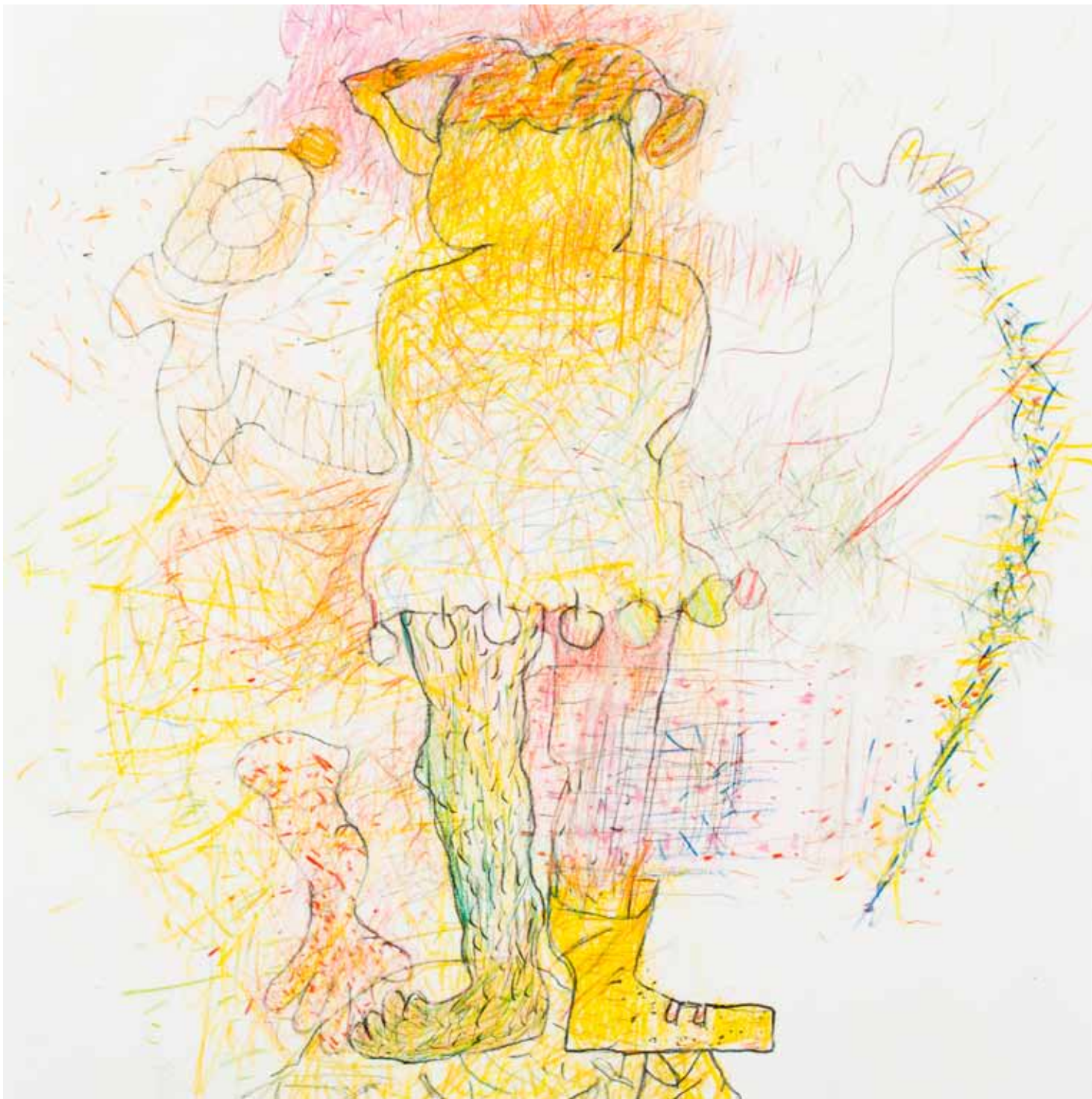
für gewöhnlich sterbliche unsichtbar buntstift papier 25 x 25 cm