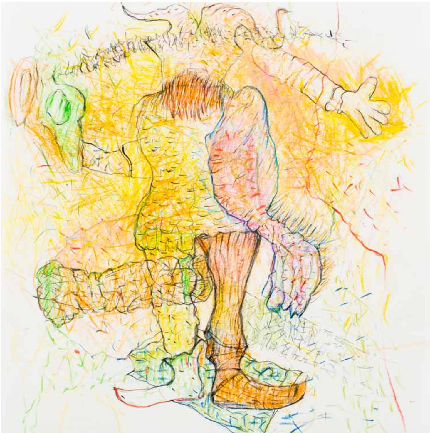
ziegenanimator buntstift papier 25 x 25 cm