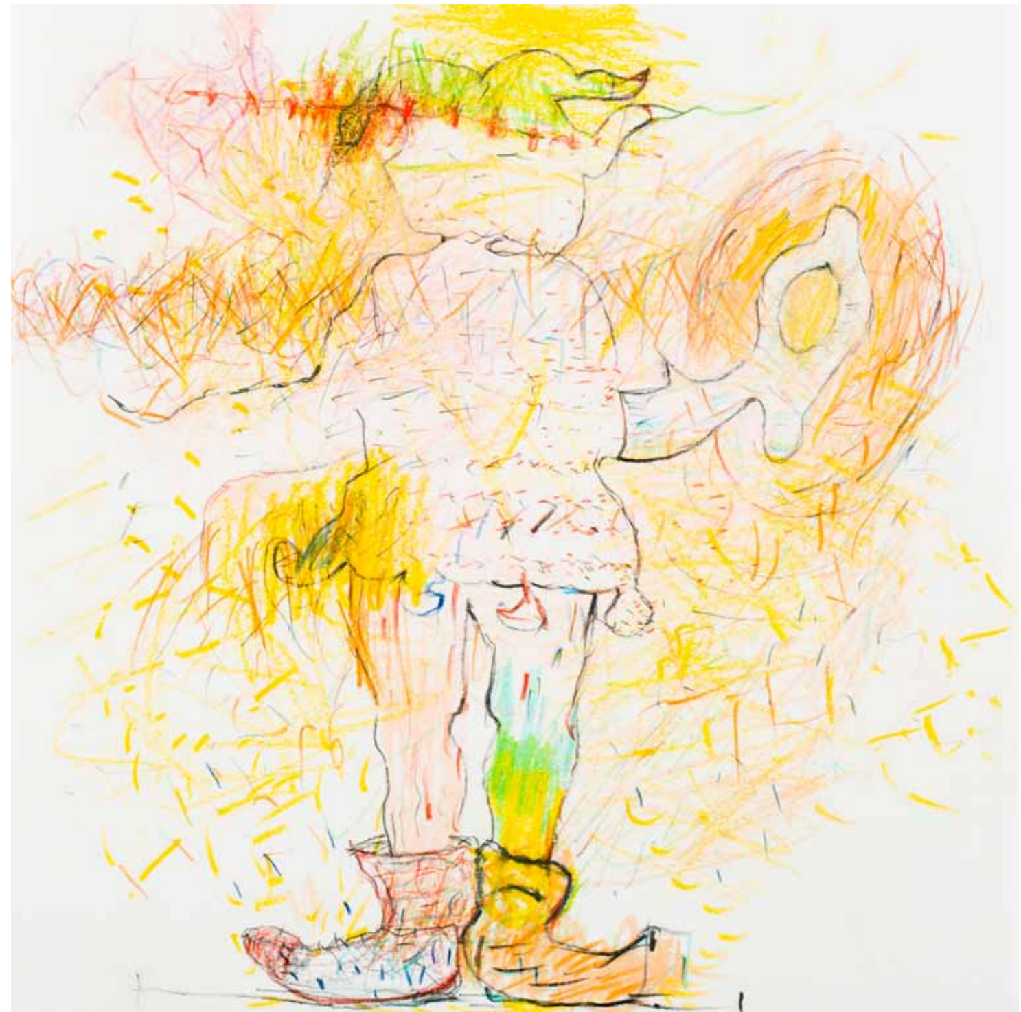
wiedenkopf buntstift papier 25 x 25 cm