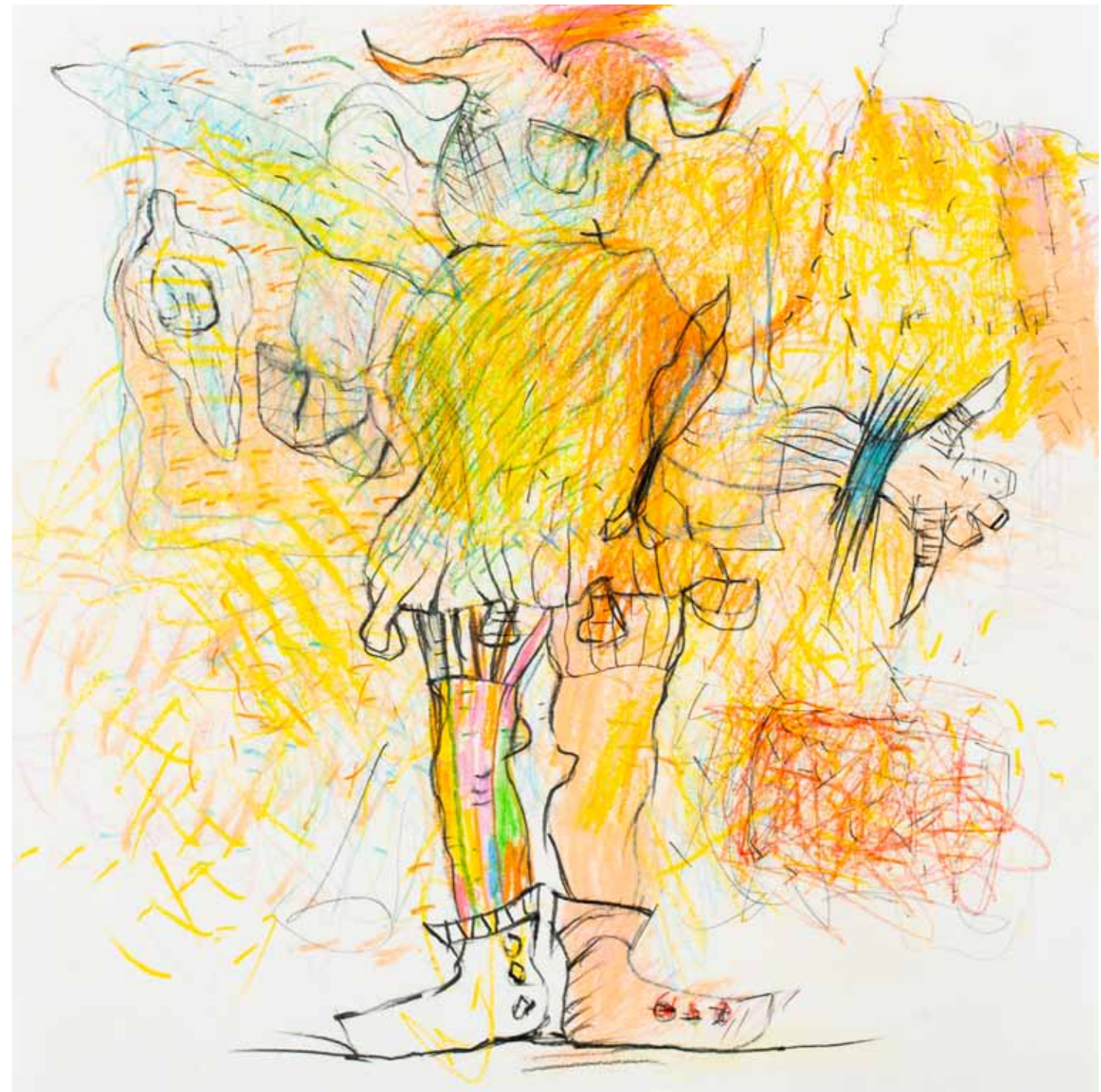
das schöne an der vergangenheit buntstift papier 25 x 25 cm