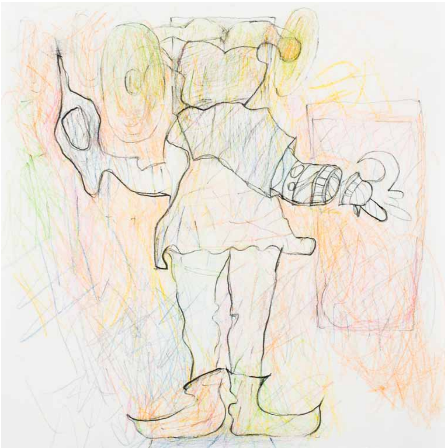
eulung buntstift papier 25 x 25 cm