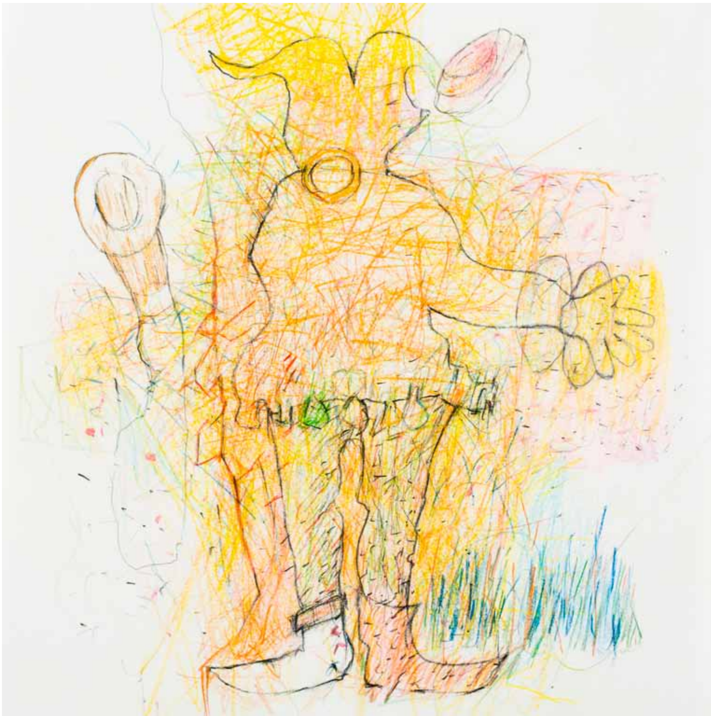
fliegenmelker buntstift papier 25 x 25 cm