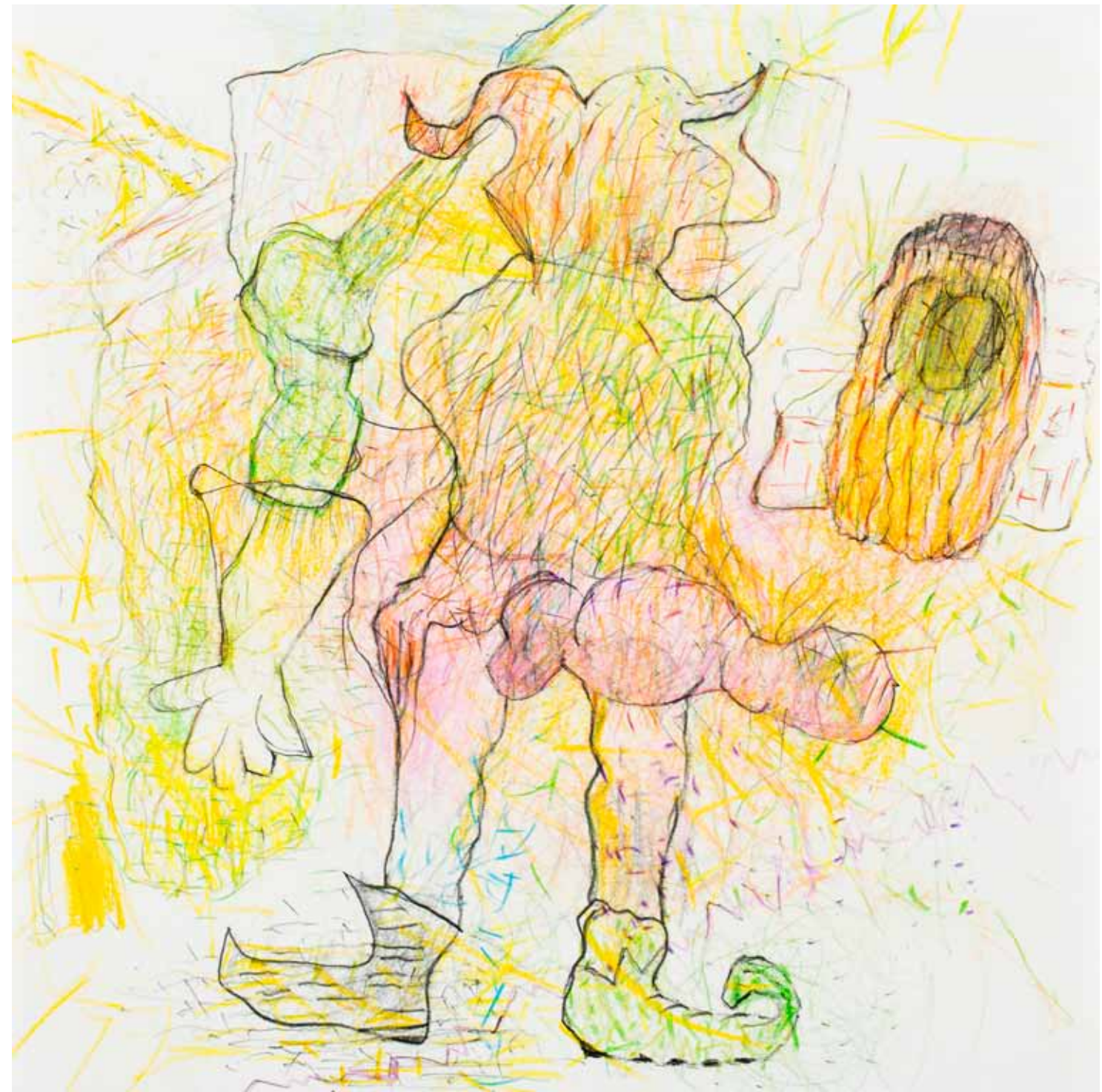
großes versteckspiel buntstift papier 25 x 25 cm