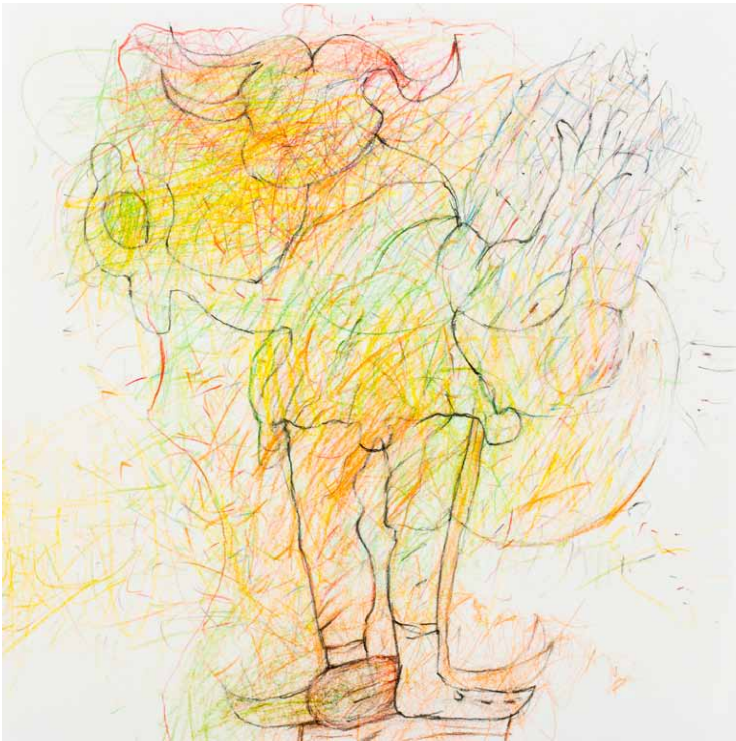
ehrlicher lügner buntstift papier 25 x 25 cm