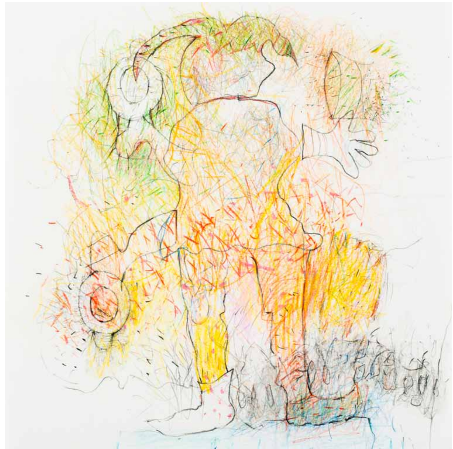
irgendeiner verwirrenden tätigkeit nachgehen buntstift papier 25 x 25 cm