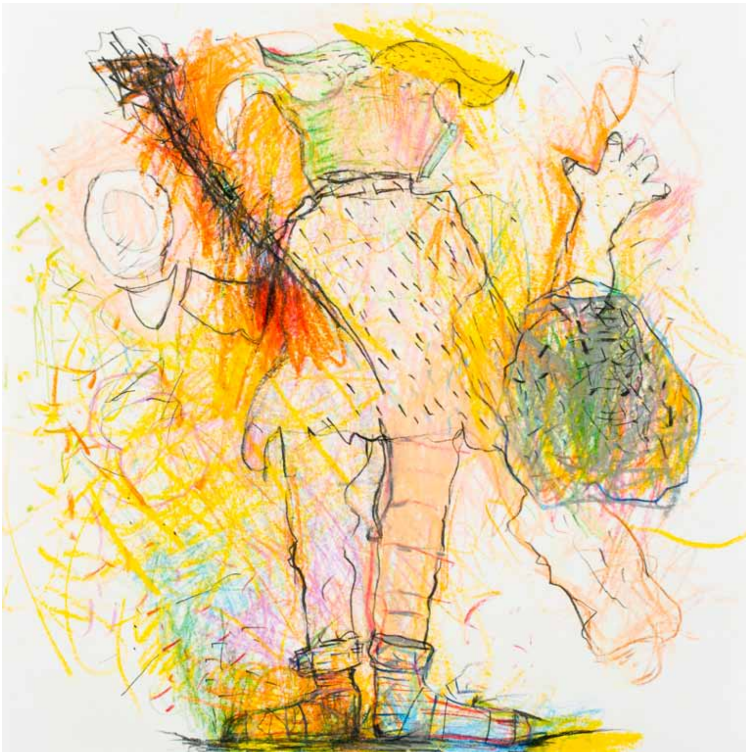
bingo pajama buntstift papier 25 x 25 cm