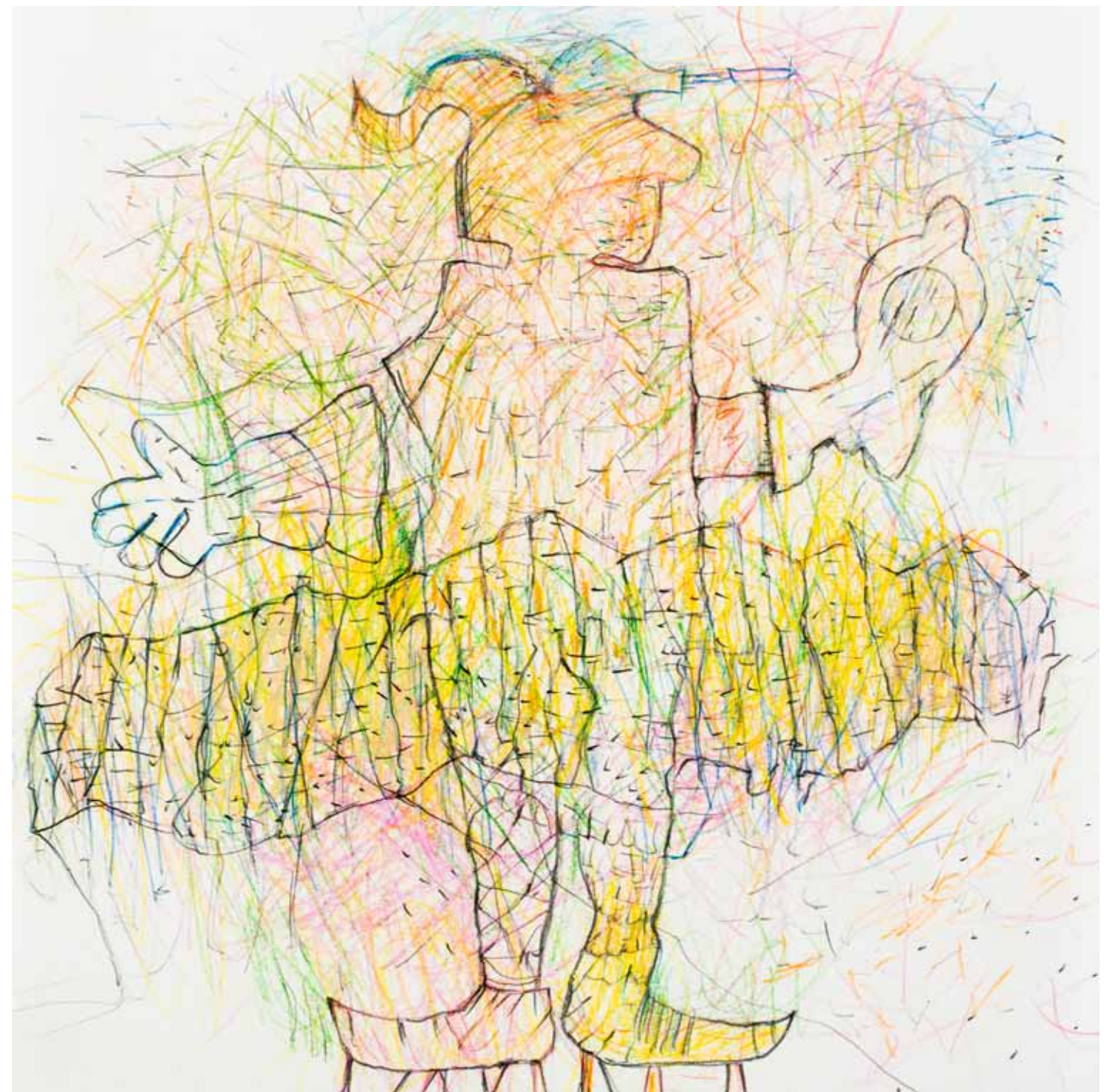
beschäftigter i.r. buntstift papier 25 x 25 cm